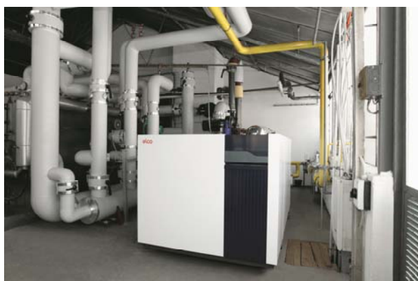
Figura 1: Scorcio del locale tecnico della Schäfle Rosen AG con la nuova caldaia a gas a condensazione RENDAMAX 3409.

* Valori effettivamente misurati (inferiori rispetto a quanto indicato nei dati tecnici)