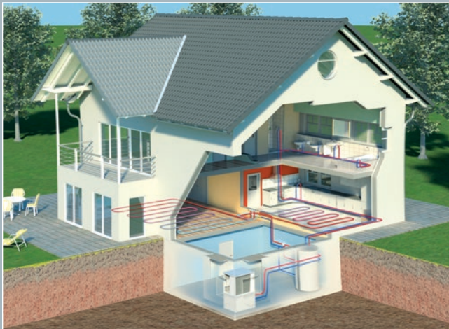
Innenaufstellung einer Wärmepumpe ELCO AEROTOP® T

Bei der Heizungserneuerung in bestehenden Gebäuden ist vieles vorgegeben. Deshalb ist es von Vorteil, dass die ELCO AEROTOP® T bei der Innenaufstellung anpassungsfähig ist. Unterschiedliche Anschlussmöglichkeiten für die Luftführung eröffnen eine Lösung bei der Wahl des Aufstellungsortes. Für besonders enge Einbringsituationen ist zudem eine 2-teilige Ausführung erhältlich. Die geringe Bauhöhe, optimal abgestimmte Kältetechnik, sowie niedrige Betriebsgeräusche sind weitere Vorteile der ELCO AEROTOP® T Wärmepumpe.