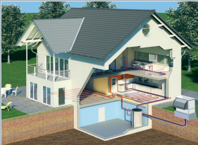
Aussenaufstellung einer ELCO AEROTOP® T Wärmepumpe

ELCO AEROTOP® T Wärmepumpen arbeiten effizient: Durch den Einsatz von 1 kWh elektrischer Energie werden im Durchschnitt mehr als 3 kWh Heizenergie erzeugt. Dieser hohe Wirkungsgrad wird insbesondere in Kombination mit Niedertemperatur- oder Fussbodenheizungen erreicht. Und auch optisch machen ELCO AEROTOP® T Wärmepumpen einen starken Eindruck. Das ansprechende Design unterstreicht das solide und zeitlose Erscheinungsbild.