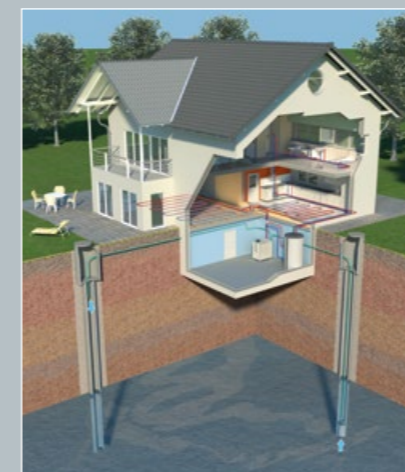
Produzione di energia con acqua di falda

Le termopompe AQUATOP® T si distinguono per la loro qualità e affidabilità. Vengono utilizzati esclusivamente materiali pregiati. Le termopompe AQUATOP® T soddisfano le severe norme qualitative europee e hanno ottenuto il marchio di qualità internazionale per termopompe, che considera non solo la qualità del prodotto, ma anche l'affidabilità dell'organizzazione di servizio.