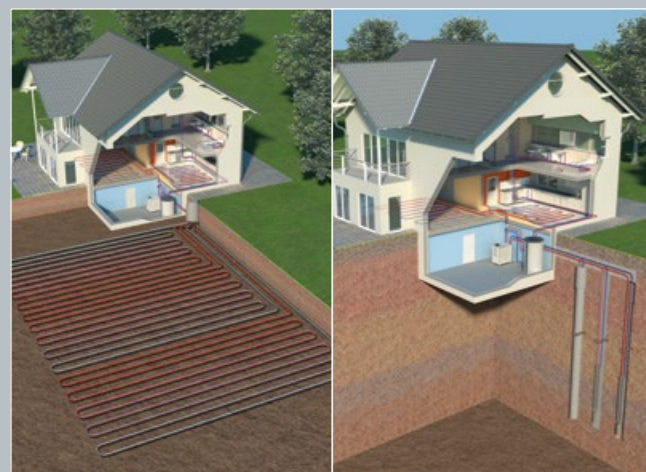
Sfruttamento geotermico mediante collettori

Come antigelo si utilizza il glicole, da cui il nome termopompe acqua glicolata-acqua. La termopompa porta l'energia termica prelevata a una temperatura, detta di mandata, necessaria per il riscaldamento della casa. A tale scopo viene consumata elettricità, per cui vale la regola: minore è la temperatura di mandata, maggiore è l'efficienza energetica.