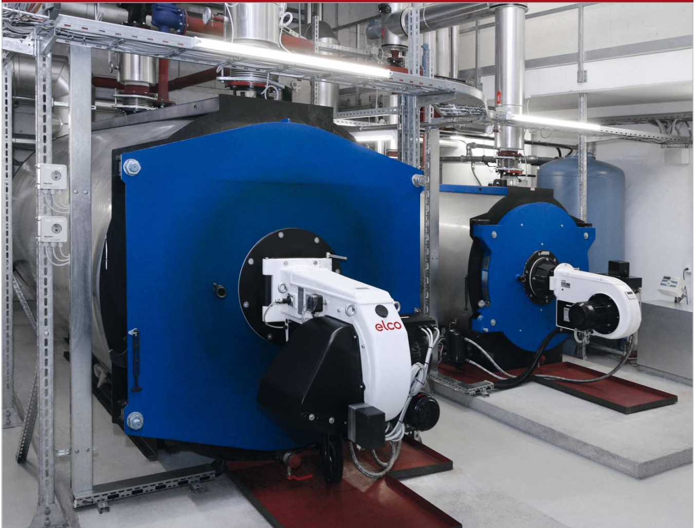
Die beiden Ölkessel im Westside sind mit ELCO Brennern ausgestattet.