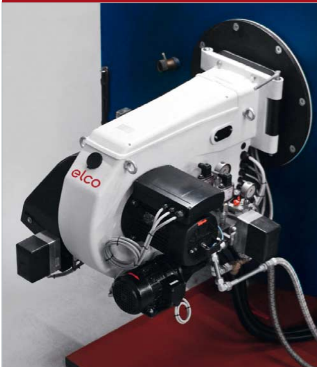
ELCO Brenner mit «F2»-Freiflammtechnik

Die Freiflammtechnik erfüllt die strengen Abgasvorschriften der Schweiz problemlos.