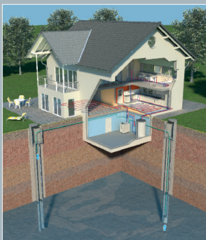
Produzione di energia con acqua di falda

Le termopompe AQUATOP si distinguono per la loro qualità e affidabilità. Vengono utilizzati esclusivamente materiali pregiati. Le termopompe AQUATOP soddisfano le severe norme qualitative europee e hanno ottenuto il marchio di qualità internazionale per termopompe, che considera non solo la qualità del prodotto, ma anche l'affidabilità dell'organizzazione di servizio.