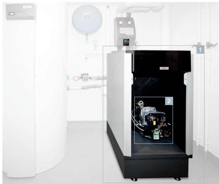
(1) Unité/chaudière (2) Brûleur à air pulsé