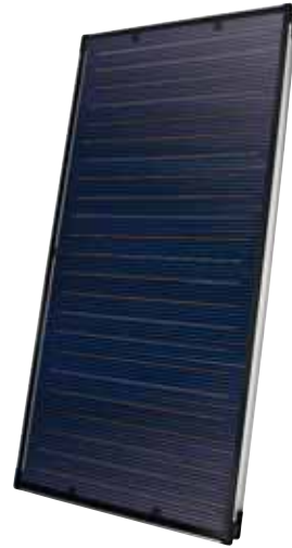
SOLATRON S 2.5 V (vertikal)

Der Schlüssel für die optimale Warmwasserbereitung und Heizungsunterstützung mit Hilfe der Sonne liegt in der perfekten Abstimmung der Komponenten. ELCO bietet Ihnen komplette Solarsysteme. Dazu zählen Solar-, Brauchwasser- und Pufferspeicher in vielen verschiedenen Grössen für eine optimale Auslegung der Solaranlage an Ihre Anforderungen. Pufferspeicher können die erzeugte Wärme über längere Zeiträume speichern. Solarregler sorgen dafür, dass die auf dem Dach gewonnene Wärme so effektiv wie möglich genutzt werden kann. Dazu kommt eine spezielle ELCO Pumpengruppe als Basis- und Kaskadenmodul.