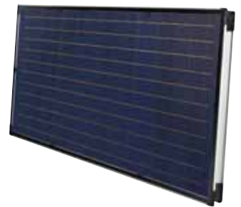
SOLATRON S 2.5 H (horizontal)