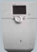
Solarregler LOGON B SOL