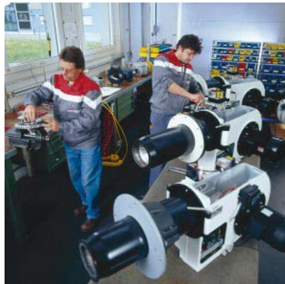
Produzione svizzera e montaggio nello stabilimento di Vilters/Sargans