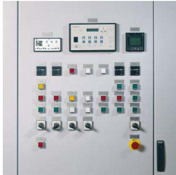
Quadri elettrici ad armadio individuali per comandare e controllare sistemi completi in funzione del fabbisogno

I bruciatori industriali a gasolio, a gas o bicom- bustibile della ELCOTHERM sono fabbricati e montati nel proprio stabilimento di Vilters/Sargans e infine sottoposti a un completo controllo di funzionamento.