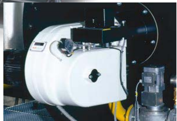
Bruciatore a gas