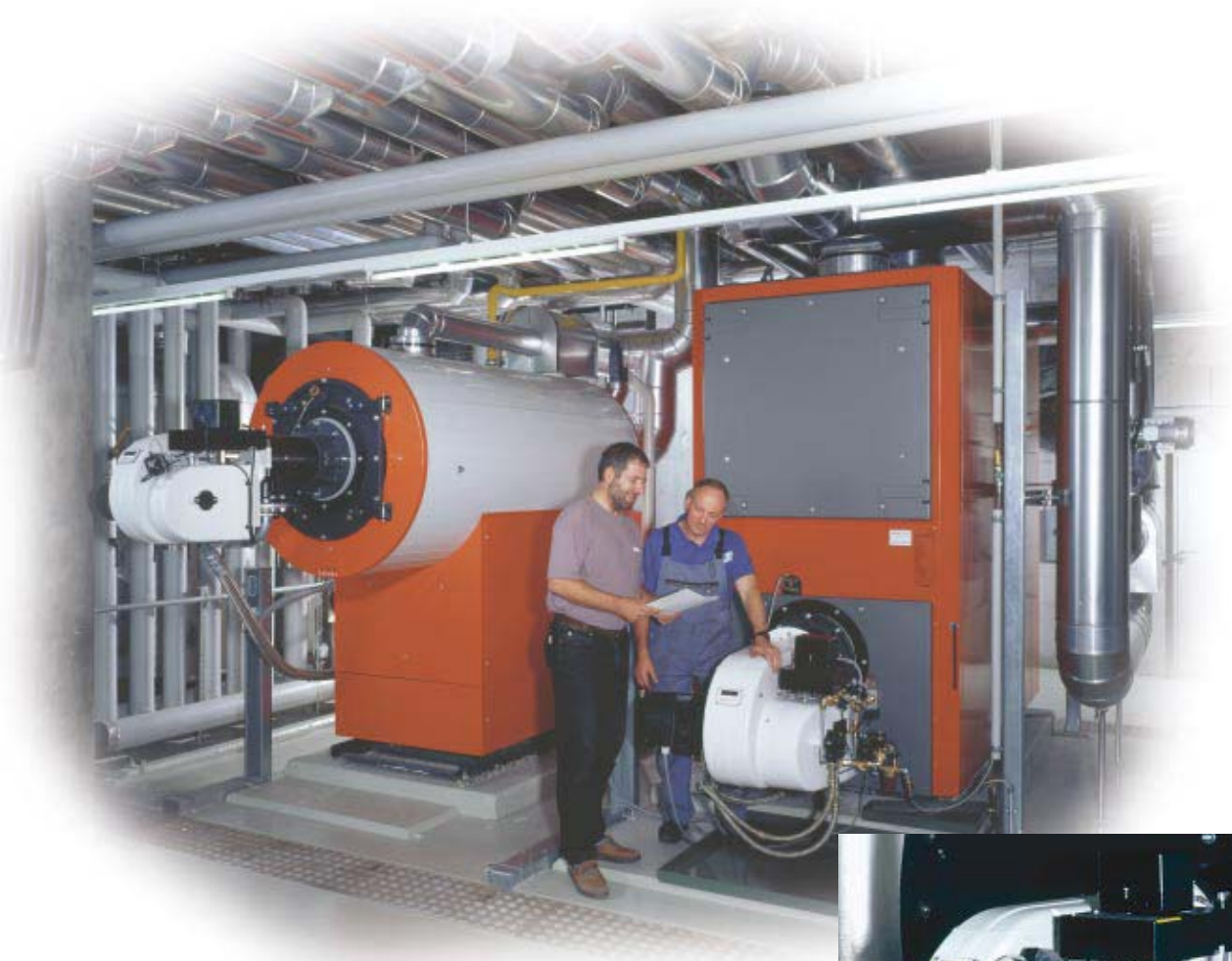
Impianto combinato con sistema a gas e a gasolio