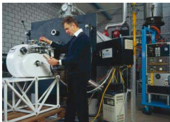
Laboratorio di ricerca e sviluppo per bruciatori

Il centro di ricerca e sviluppo della ELCOTHERM costituisce una base sicura per il perfezionamento e l'ottimizzazione della tecnica di combustione.